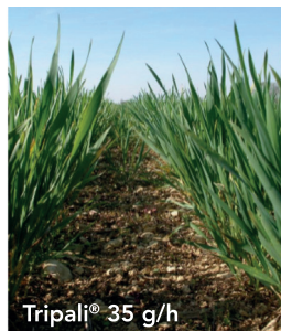
Tripali® 35 g/h